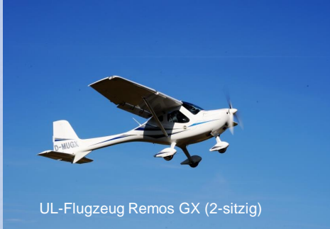
UL-Flugzeug Remos GX (2-sitzig)