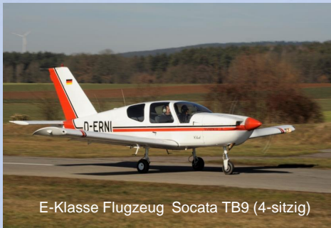
E-Klasse Flugzeug Socata TB9 (4-sitzig)