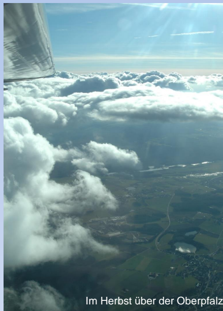
Im Herbst über der Oberpfalz

Info unter www.aeroclub-schmidgaden.de facebook.com/aeroclub.schmidgaden/